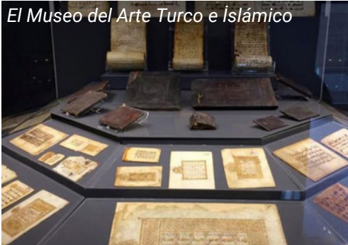
El Museo del Arte Turco e Islámico

Tome el funicular desde la Plaza de Taksim y siga hasta Kabataş. Desde Kabataş, tome el tren T1 hasta y siga la estación de Sultanahmet. Desde la estación de Sultanahmet el Museo del arte turco e islámico se encuentra a poca distancia.