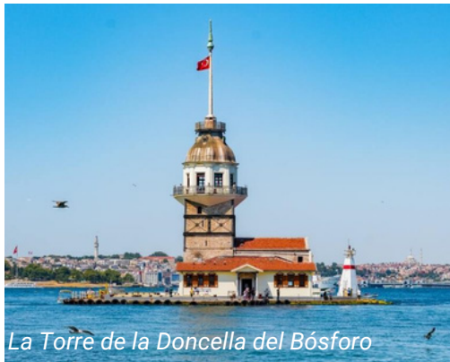
La Torre de la Doncella del Bósforo

Tome el funicular desde la Plaza de Taksim y siga hasta Kabataş. Desde la estación de Kabataş, camine hasta el puerto de Kabataş. El ferry sale de la zona de Dentura.