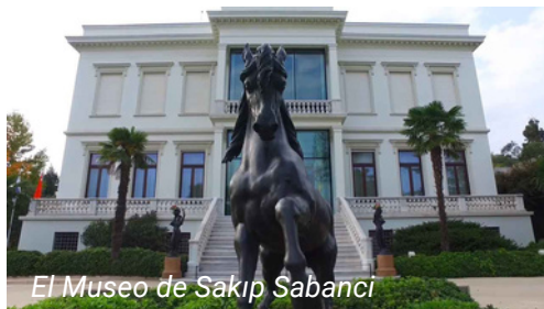
El Museo de Sakıp Sabancı

Tome el funicular desde la Plaza de Taksim y siga hasta Kabataş. Desde la estación de Kabataş, tome el autobús 25E y siga hasta la estación de Çınaraltı. Desde la estación se puede llegar al museo a pie.