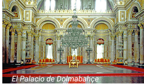
El Palacio de Dolmabahçe

Tome el funicular desde la Plaza de Taksim hasta Kabataş. El Palacio de Dolmabahçe se encuentra a 5 minutos a pie de la parada de tranvía de Kabataş.