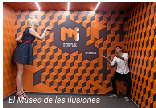
El Museo de las ilusiones

El Museo de las ilusiones fue inaugurado por primera vez en 2015 en Zagreb. Más tarde aparecieron 15 museos de ilusiones diferentes en 15 ciudades diferentes. El Museo de las ilusiones de Estambul ofrece a sus visitantes a todos los grupos de edad y garantiza un buen pasatiempo, especialmente para las familias. El museo