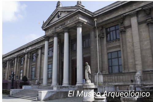
El Museo Arqueológico

Tome el funicular desde la Plaza de Taksim y siga hasta Kabataş. A continuación, tome el tranvía T1 y siga hasta Sultanahmet. El Museo Arqueológico se encuentra a poca distancia a pie.