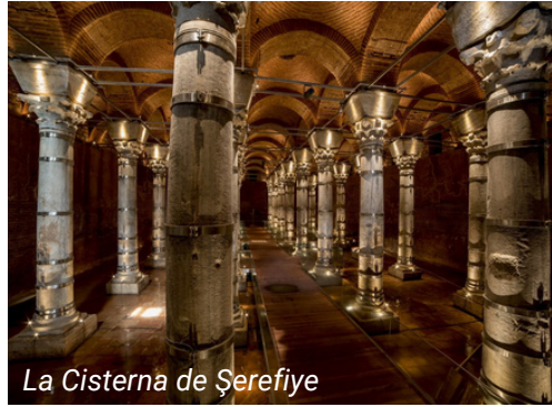
La Cisterna de Şerefiye

Tome el funicular desde la Plaza de Taksim y siga hasta la estación de Kabataş. Desde la estación de Kabataş, tome el tranvía T1 y siga hasta la estación de Çemberlitaş. Después, camine a pie durante 5 minutos hasta la Cisterna de Şerefiye.