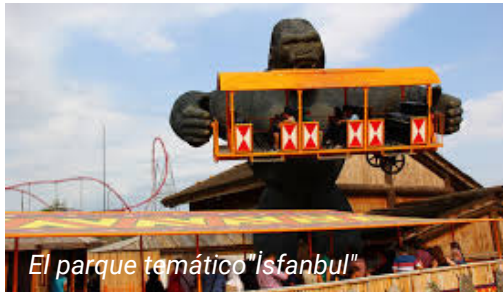
El parque temático "İsfanbul"

Tome el funicular desde la Plaza de Taksim y siga hasta Kabataş. Desde la estación de Kabataş, tome el tranvía T1 y siga hasta la estación de Eminönü. Desde la estación de Eminönü, tome el autobús 99Y que se para en el lado opuesto del puente de Gálata y siga hasta la estación de Maliye Blokları. Desde la estación de Maliye Blokları, "İsfanbul" está a poca distancia.