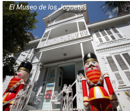
El Museo de los Juguetes

Tome el funicular desde la Plaza de Taksim y siga hasta Kabataş. Desde la estación de Kabataş, tome el ferry y siga hasta Üsküdar. Allí, tome el tren MARMARAY y siga hasta la estación Göztepe. La estación del Museo de los juguetes se encuentra a poca distancia a pie.