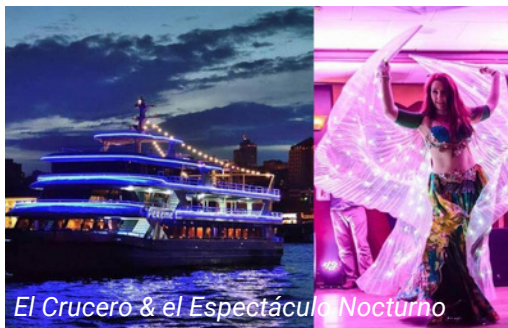
El Crucero & el Espectáculo Nocturno