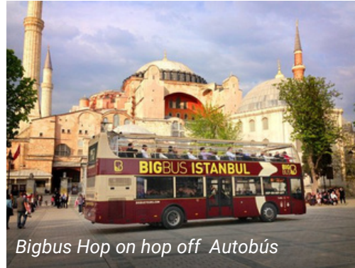
Bigbus Hop on hop off Autobús

Después de que uno se baja, el conductor puede aterrizar al otro pasajero. El precio establecido también. Varía según la distancia.