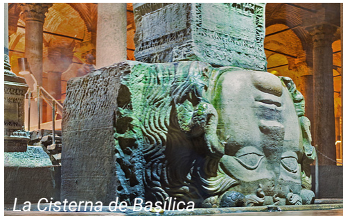
La Cisterna de Basílica

Tome el funicular desde la Plaza de Taksim hasta Kabataş. Desde Kabataş, tome el tranvía T1 hasta la estación de Sultanahmet. Se encuentra a poca distancia de la mayoría de los hoteles de la zona.