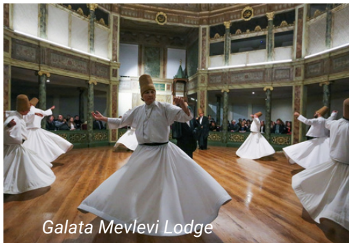
Galata Mevlevi Lodge

Tome el tranvía T1 y siga hasta Kabataş. Desde la estación de Kabataş, tome el autobús 29D y siga hasta la estación de