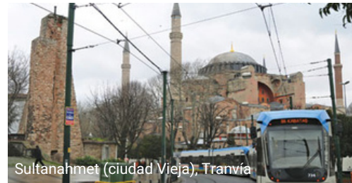
Sultanahmet (ciudad Vieja), Tranvía

Si desea llegar a algún lugar lo más rápido posible, entonces la solución es un taxi. Esta es la ruta más rápida, si no se tiene en cuenta el tráfico, que le llevará desde el punto A al punto B, independientemente de la hora del día. Las reglas para los taxis son simples. No negociamos el precio del Servicio. Cada taxi tiene un contador. No damos propina a los taxistas, pero dejamos el cambio. Por ejemplo, si el contador muestra 38 TL, le damos 40 y decimos: "no hay cambio".