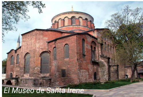
El Museo de Santa Irene

Tome el funicular desde la Plaza de Taksim y siga hasta Kabataş. Desde la estación de Kabataş, tome el tren T1 y siga hasta la estación de Sultanahmet. Desde la estación, camine a pie hasta el Palacio de Topkapı. El Museo de Santa Irene se encuentra en el primer Jardín del palacio.