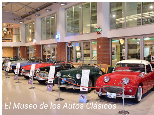
El Museo de los Autos Clásicos

Tome el funicular desde la Plaza de Taksim y siga hasta Kabataş. Desde la estación de Kabataş, tome el autobús 29D y siga hasta la estación de Metin Oktay. El museo está a poca distancia de la estación.