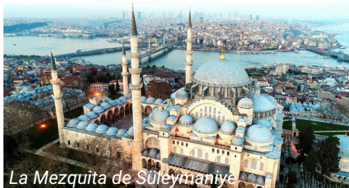
La Mezquita de Süleymaniye

Tome el autobús 32D, 35C, 76D, 80T o 89C, siga hasta la estación Halim Iscan gecidi / bicycle market. Desde la estación la Mezquita de Süleymaniye se encuentra a 10 minutos a pie.