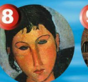
8 Casa Modigliani visits by appointment