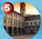
5 Sanctuary opening time 8:30-18:00