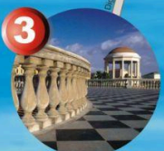
3 Acquario 10:00 - 18:00 Closed on Monday