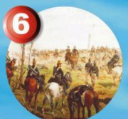
6 10:00 - 13:00 • 16:00 - 19:00 Closed on Monday