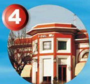
4 Baracchina Rossa Porticcioli