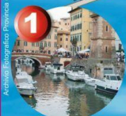
1 Quartiere Venezia Fortezza Nuova

Legenda — Linea - Route - Linea - - - Funicolar to Montenero Family Attractions Boat Tour Bath establishment Funicolar