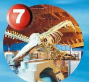
7 TUE, THU, SAT & SUN: 9-13 e 15-19 WED & FRI: 9-13 - Closed on Monday